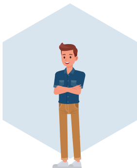
Ausgeprägtes Verantwortungs- bewusstsein