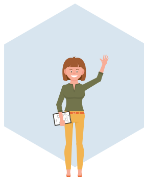
Ausgeprägtes analytisches und zielorientiertes Denkvermögen